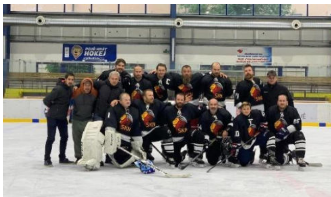
MISTŘI ČR 2022