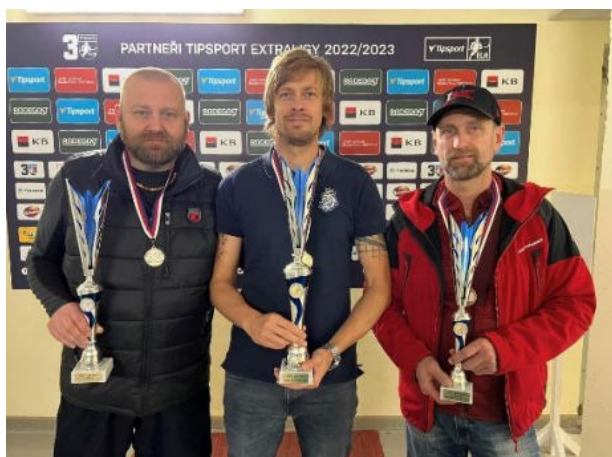
MČR 2022: 2.místo SKN Brno, 1.místo SKN HK, 3.místo SKN Plzeň