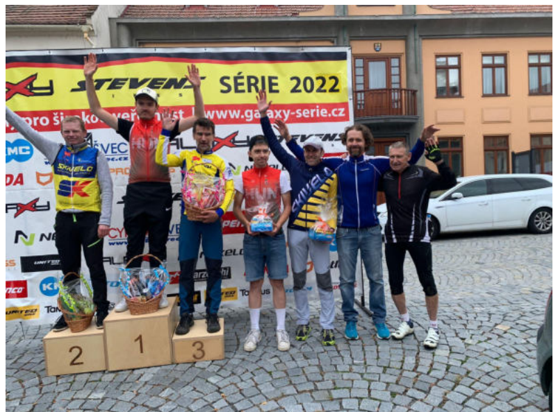
Foto stupně vítězů mezinárodní MTB neslyšících