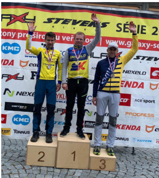
Foto stupně vítězů MČR