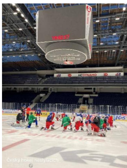
Reprezentace - soustředění